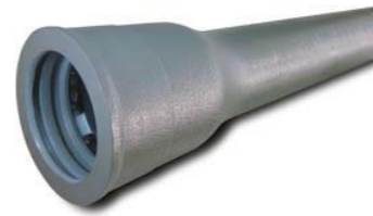
<耐震型ダクタイル鋳鉄管>